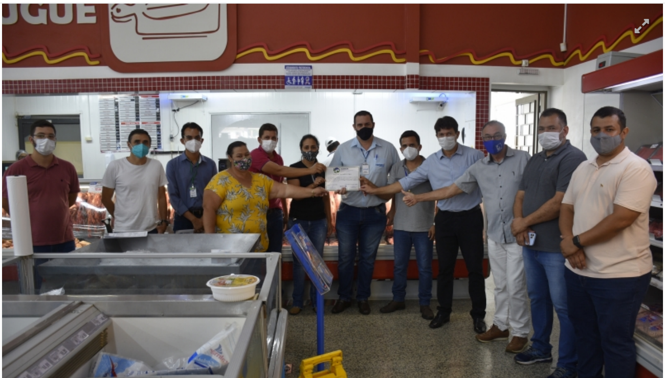
Momento da entrega de registros de estabelecimentos em Costa Rica