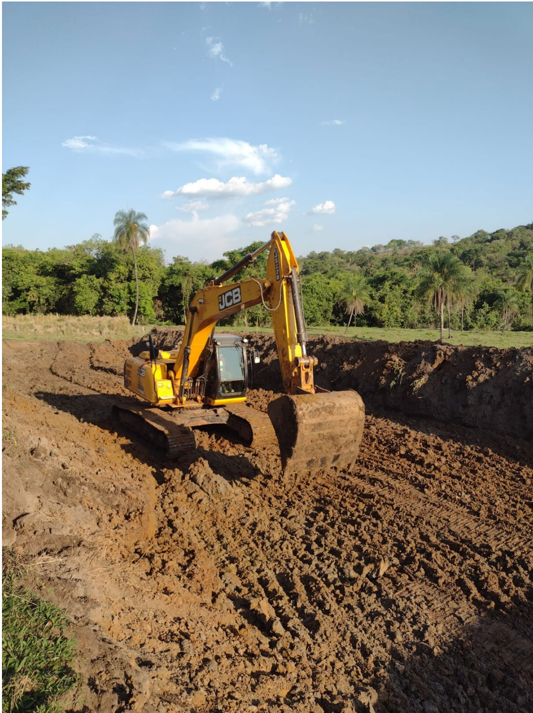
Foto 4 – Construção de tanque de peixe através da escavadeira hidráulica da Prefeitura de Costa Rica