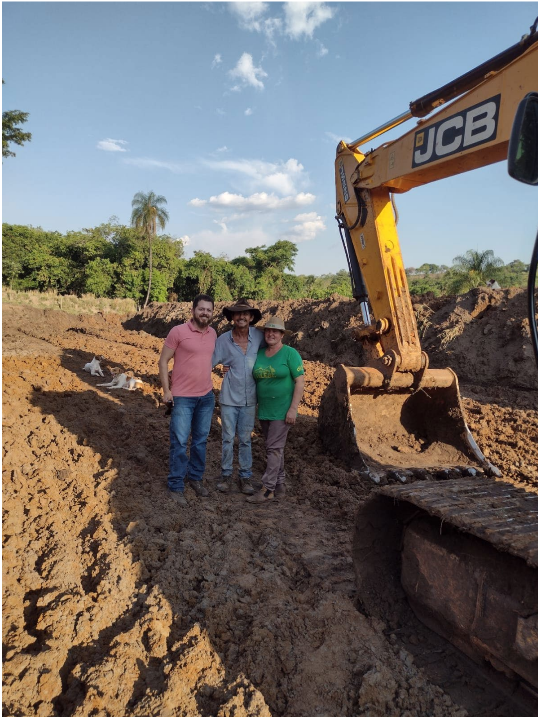
Foto 5 – Construção de tanque de peixe através da escavadeira hidráulica da Prefeitura de Costa Rica